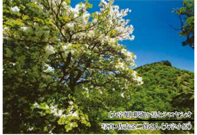
(大字旭)釈迦ヶ岳とシロヤシオ