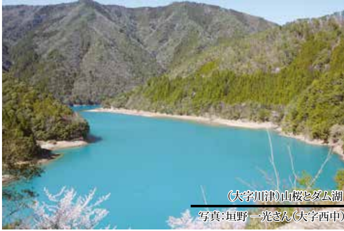
(大字川津)山桜とダム湖