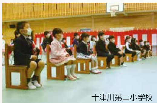
十津川第二小学校

4月7日、8日に村内各小・中学校で入学式が行われました。本年度の新入生は、第一小学校が6人、第二小学校が11人、中学校が16人です。 新型コロナウイルス感染症予防として、各校では出席者全員がマスクを着け、座席の間隔を空けるなどの対応がとられて式が挙行されました。また、出席できた在校生が、小学校は6年生のみ、中学校は3年生のみ、保護者の人にも制限があるなど、いつもとは違う趣での入学式となりました。